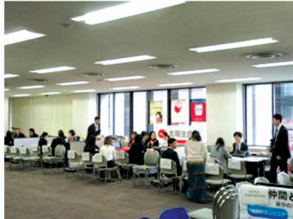
Myanmar Career Fair ကျင်းပစဉ်