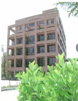
リーガルクリニックのある文化科学系総合研究棟

前日までにお電話でご予約のうえ、おこしください。今年度は、 5月28日(月) から予約受付を行います。