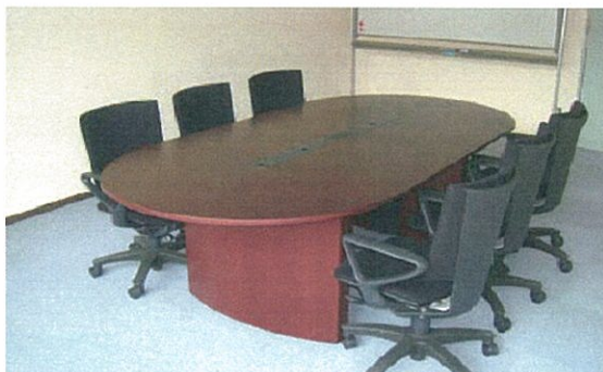
法律相談が行われるリーガルクリニック室