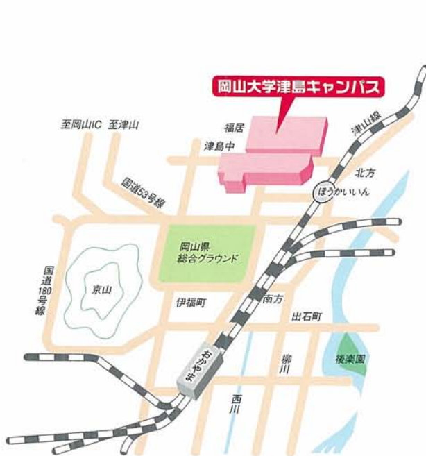
岡山大学津島キャンパス