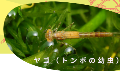
ヤゴ（トンボの幼虫）