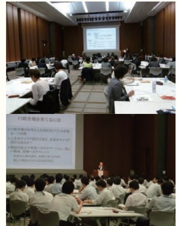
上：女性課長相当職情報交換会の様子 下：本店本部管理職向け女性活躍推進セミナーの様子

個人および企業向け各種保険の引受け・保全サービス、有価証券投資・貸付・不動産投資など受託資産の運用、付随業務