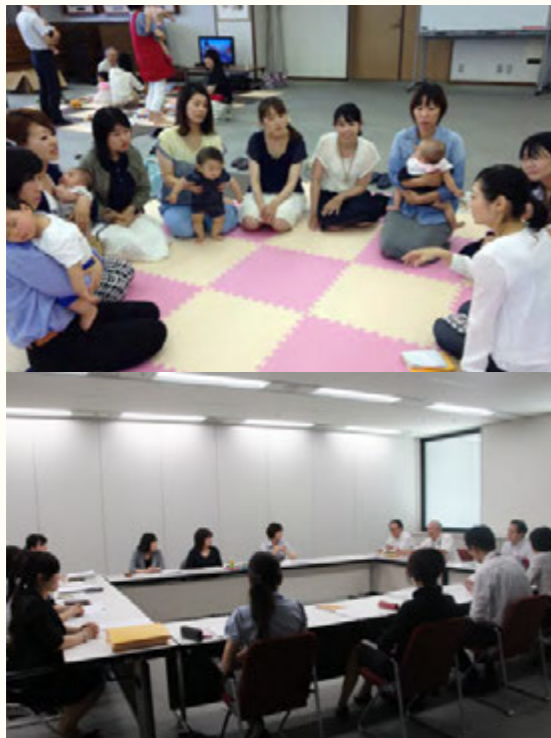
上：休日講座「志学塾」女性活躍推進セミナーの様子 下：にじいろHeartプロジェクトの様子