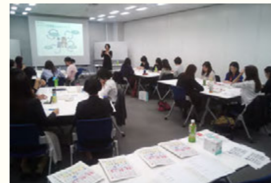
社内のダイバーシティ研修の様子