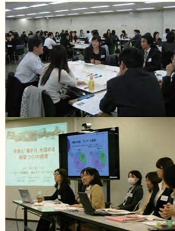
上：女性社員上司を交えてのダイバーシティ研修会 下：女性研修報告会での発表風景