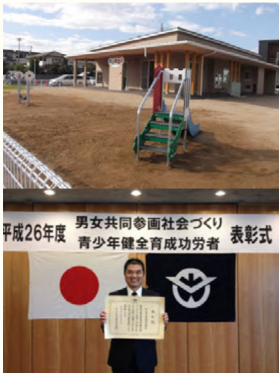
上：事業所内保育所「おもいやり保育園」の外観 下：平成26年度 男女共同参画社会づくり表彰式の様子

各種自動車用部品、福祉機器、ウォーキングバイシクル、金型・専用機等の製造、及び弁当の調理・宅配ほか URL http://katayamakogyo.jp/