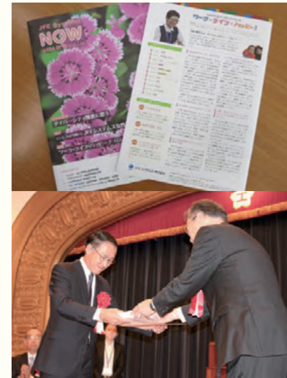
上：社内報に掲載しているワークライフバランス連載記事 下：均等・両立推進企業表彰で東京労働局長奨励賞を受賞

ERPを中核に、業種トータルソリューション、業務ソリューション、インフラソリューションの3つのカテゴリを柱としたトータルソリューション事業を展開しています。 URL http://www.jfe-systems.com/