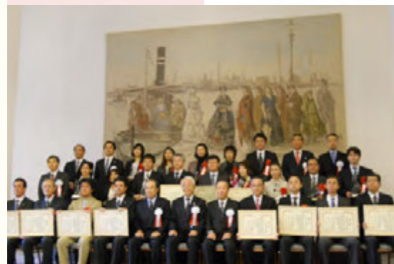
上：育児支援ガイドブック 下：ひょうご仕事と生活のバランス企業表彰の様子