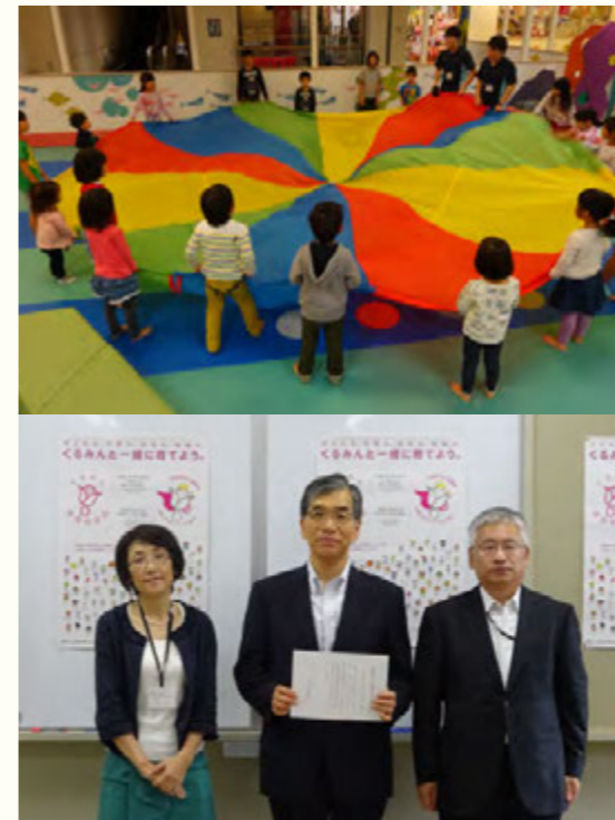
上：ファミリーミーティングの様子 下：くるみん授賞式の様子

岡山大学を設置し、これを運営すること。学生に対し、修学、進路選択及び心身の健康等に関する相談その他の援助を行うこと。法人以外の者から委託を受け、又はこれと共同して行う研究の実施、その他の法人以外の者との連携による教育研究活動を行うこと、など。 URL http://www.okayama-u.ac.jp/user/jinj/iversity/