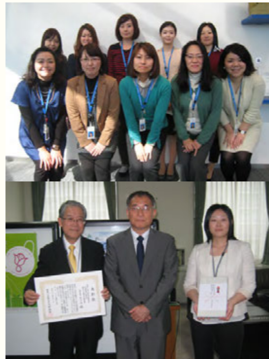
上：2015 e-ハーモニーメンバー 下：2014均等両立表彰表彰式の様子

お客様企業の業務改善・構想策定等のシステム全般に関するコンサルティング、IT企画・設計・開発・構築・運用・保守・アウトソーシング及びクラウドサービスの提供、ならびにソフトウェア・ハードウェアの開発・販売・サービス提供 URL http://www.exa-corp.co.jp/