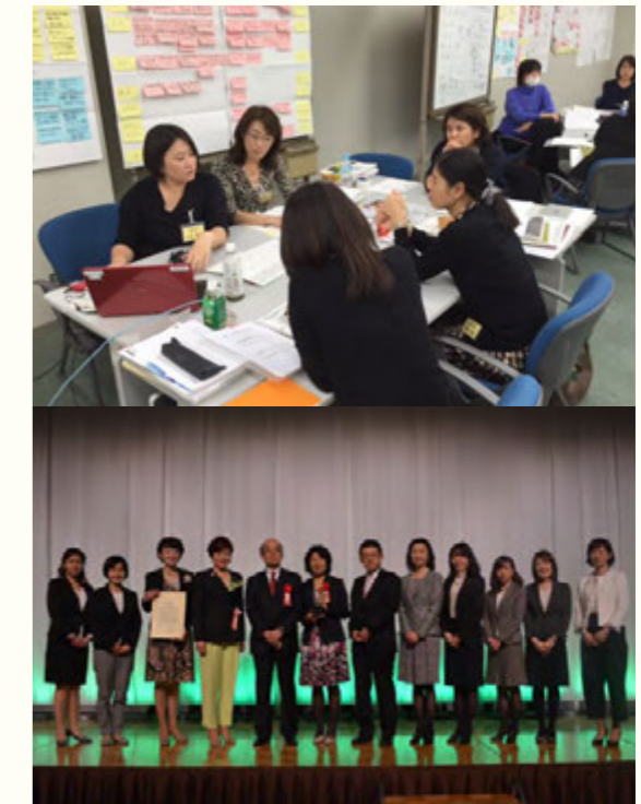
上：女性経営塾(女性管理職を目指す方の勉強会)の様子 下：J-winダイバーシティアワード2015準大賞を受賞

損害保険事業 1. 損害保険の引受、2. 損害調査および保険金の支払い、3. 新商品の企画・開発、4. 資産運用、5. 国際関連事業、6. その他各種事業 URL http://www.sjnk.co.jp/