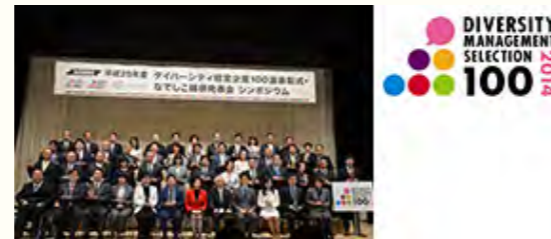
経済産業省主催「ダイバーシティ経営企業100選」受賞

URL http://www.tokiomarine-nichido.co.jp/