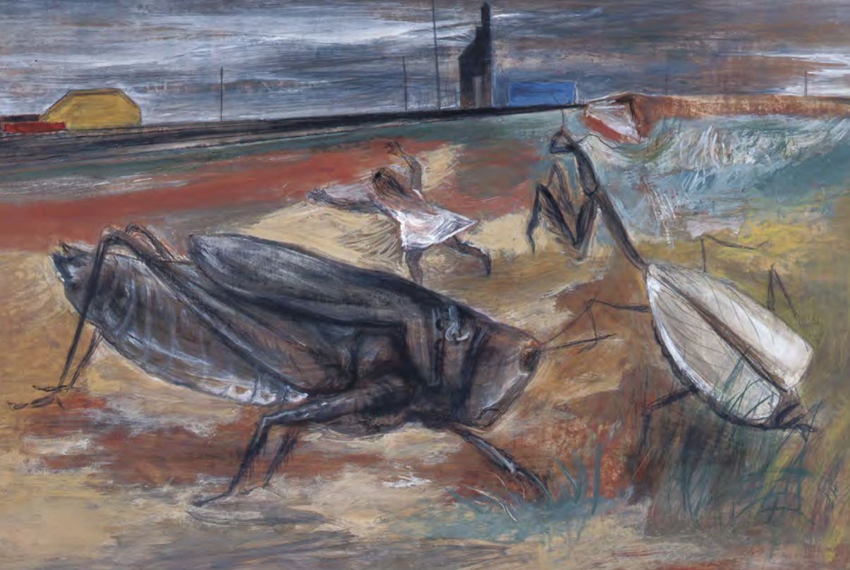
「少女よ、お前の命のために走れ」福武コレクション所蔵 1946年