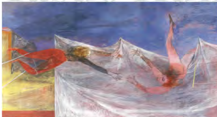
「安眠を助げる夢」福武コレクション所蔵 1948年