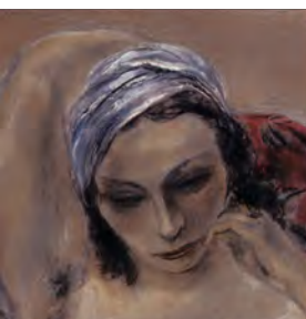
「もの思う女」福武コレクション所蔵 1935年

SOGO MUSEUM OF ART & BENESSE ART SITE NAOSHIMA