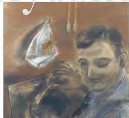
「ウィリアム・グロッパーの肖像」山陽放送株式会社所蔵 1938年