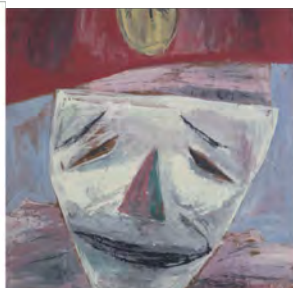
「クラウン」福武コレクション所蔵 1948年