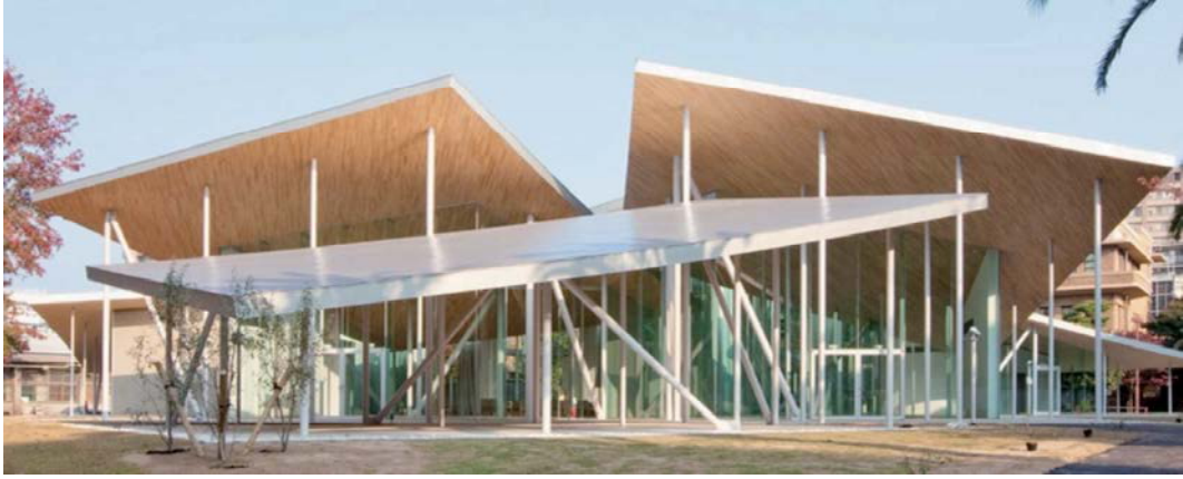
Junko Fukutake Hall (Jホール) (岡山大学鹿田キャンパス内) 〒700-8558 岡山市北区鹿田町2丁目5番1号