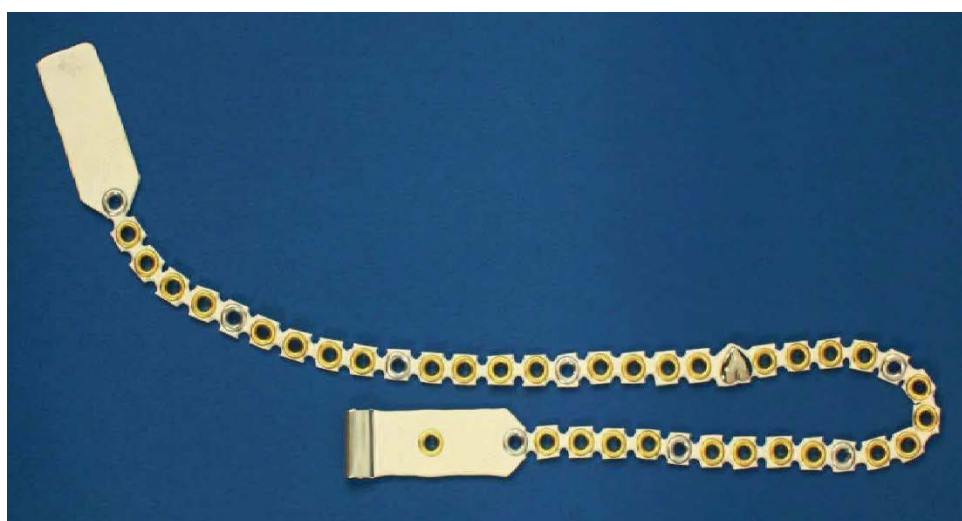
図 1. 商品化されたカフ型カテーテルの挿入補助器具「Dot Marker ® 」

さらに開発された挿入補助具は、有限会社ケイ・テクノ社（倉敷市）より「Dot Marker ® 」という商品名で 6 月 25 日に発売開始となりました（図 1、2）。また、2018 年 6 月 27～29 日に東京ビッグサイト（東京都江東区）で開催される「BIO tech 2018」に出展を予定しています。