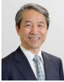
榎野 博史 岡山大学 学長

1948年岡山県生まれ。1975年岡山大学医学部医学科卒業、岡山大学医学部助手、同教授などを経て2001年に同大学院医歯学総合研究科教授。2009年から大学院医歯学総合研究科長を務めた。2011年から岡山大学病院長、同大理事を歴任し、2017年4月より岡山大学長(第14代)に就任。就任時よりSDGsの各プロジェクトと岡山大学の活動を連動させ、社会課題解決のプロセスを実質化していくことを表明し、同年12月には第1回ジャパンSDGsアワード特別賞「SDGsパートナーシップ賞」を受賞。