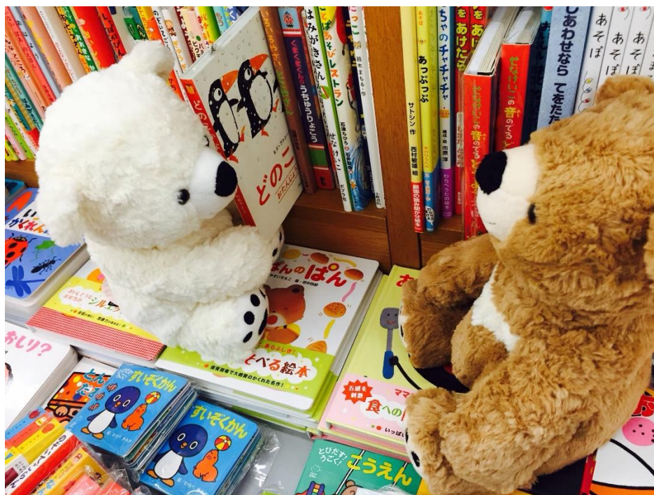
図1 子どもたちに渡す写真の例

1982年生まれ。広島大学大学院教育学研究科博士課程修了（心理学）。専門は教育心理学・発達心理学。東京大学大学院総合文化研究科にて日本学術振興会特別研究員（PD）を経て、2014年10月から岡山大学教育学研究科に所属。