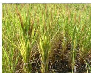
葯培養で得た4倍体雑種の系統群