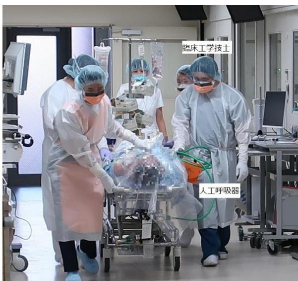
図 1. 人工呼吸器患者搬送の様子

本院では、新型コロナウイルス感染症の流行初期より、重症化した患者の受け入れを行ってきました。重症患者は、ECMO や人工呼吸器、血液浄化装置など多くの医療機器が使用されています。医療機器は、患者の容体にあった設定で使用しなければなりません。誤った使用方法や、不適切な