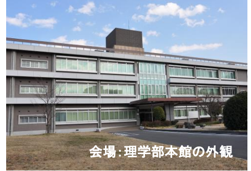
会場：理学部本館の外観