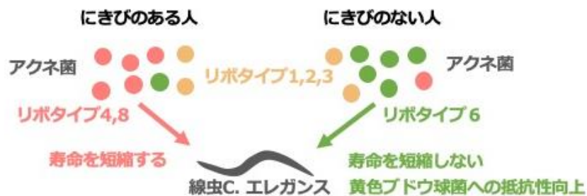
図1. にきびのある人/ない人に多いリボタイプのアクネ菌株による生体への作用

本研究グループは、線虫 C. エレガンス をモデルとして用いて、ヒトの皮膚から分離された複数のアクネ菌株の生体作用を調べました。その結果、にきび患者の肌で検出されることが多いリボタイプ (RT4,8) のアクネ菌株は線虫の寿命を短縮し、にきびのない人の肌で検出されることが多いリボタイプ (RT6) の菌株は短縮しませんでした。すなわち、アクネ菌株をリボタイプで分類すると、ヒトに対する疾患(にきび)関連性と線虫への病原性(寿命短縮効果)が相関することがわかりました(図1)。