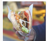
アリババ トルコ料理レストラン