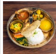
タンドールバル&カフェ