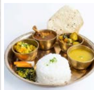
ネパール家庭料理 ダルバート