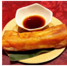
OKAYAMA KURASHIKI PHILIPINO CIRCLE