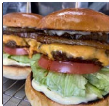
BURGER BOX BAM