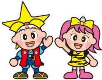
岡山県マスコット 「ももっち」「うらっち」