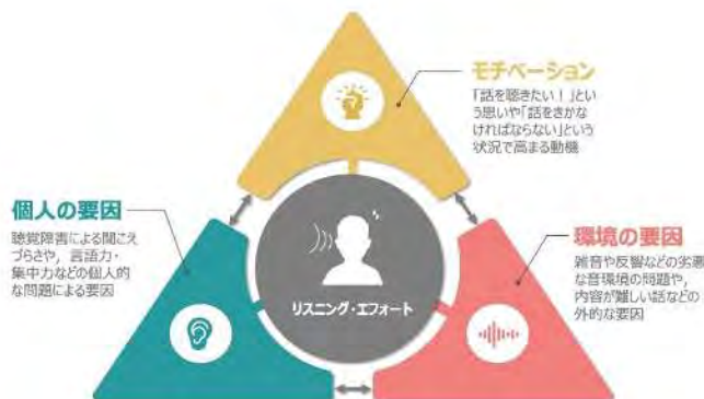
図 1 リスニング・エフォートに影響を及ぼす 3 つの要因

リスニング・エフォートには様々な要因が影響を及ぼしますが、大きく分けると①個人の要因、②環境の要因、③モチベーションに整理されます（図 1 参照）。この中でも注目したいのが、本人が「聞きたい」と思う話に対して、つまりモチベーションが高い状態ではエフォートも上がるということです。これはポジティブな意味でのエフォートと捉えることができます。リスニング・エフォートは必ずしも悪いものではなく、個人あるいは環境からの聞き取りづらさに伴って生じるネガティブな側面と、聞きたいというモチベーションに伴って生じるポジティブな側面があわさった考えであり、本人が置かれた状況や文脈を踏まえた評価・支援を提供していく必要があります。