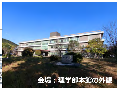
会場：理学部本館の外観