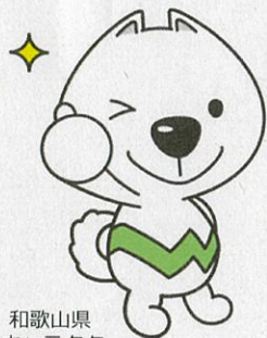
和歌山県 PRキャラクター 「きいちゃん」