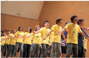
▲「うたう会みんこ」のステージの様相

公開サマーコンサートを創立五十周年記念館で開催し、地域の方々など約100人が美しい音楽と躍動感溢れるパフォーマンスを楽しみました。 このコンサートは、同窓会総会に先立ち、同窓生や日頃お世話になっている市民の皆様にも楽しんでいただくことを目的として開催しているもので、本年は学生サークル「うたう会みんこ」による民舞および合唱、「ギターアンサンブル」によるギターの生演奏が行われました。 ステージは、「うたう会みんこ」の迫力ある「ソーラン節」で幕を開け、「はねこ踊り」などの民舞やオリジナル曲の