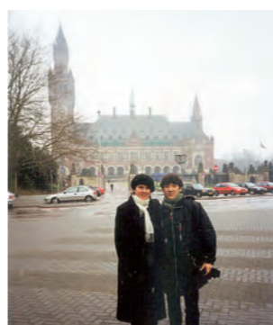
▲足繁く通ったというオランダ・ハーグにある国際司法裁判所。友人と