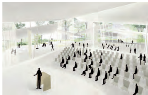
▲新ホールの内観図 (SANAA 提供)

妹島▼学内に魅力的な場所や、交流で きる空間があれば、誰もが行きやす い、親しみの持てる場所になると思 う。そういうものを考えてみたい。