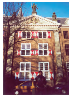
◀留学先のライデン大学の校舎。人道法の講義を受けた教室はかつて犯罪者を収容する監獄だったという