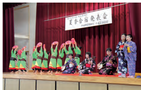
▲合宿の成果を披露する福島市の子どもたち =8月11日、岡山市立妹尾小学校

福島県の民謡に合わせて舞や三味線演奏を披露し、集まった児童や地域住民ら約400人から大きな拍手を受けた。最後は全員で「妹尾音頭」と「うらじゃ」