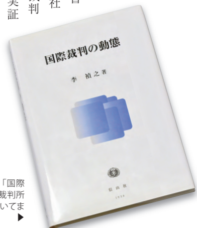
2007年に出版した著書「国際裁判の動態」。国際司法裁判所における訴訟手続きについてまとめた研究の集大成だ

「国際法はもともとヨーロッパで生まれ育ったもの。それを使うだけでなく、日本発で自身を改善していくことに貢献したい」。国際学会へ積極的に参加し、世界各国の研究者らと議論を戦わせ、研さんを積む。「グローバル化が進み、日本の中だけで完結できる社会ではなくなっている。世界に出て勝負することも大切。学生たちにも国際舞台で勝負するチャンスを与えたい」