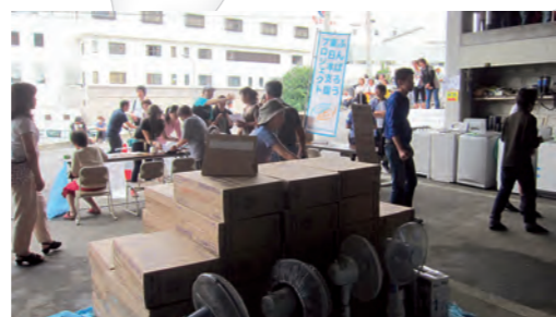
▲宮城県南三陸町でふんばろうメンバーらは支援物資の家電配布に参加した=8月1日

資源植物科学研究所(倉敷市中央)は東日本大震災で津波の被害を受けた農地の復興支援プロジェクトに取り組むための予算を平成24年度概算要求に提出した。研究所が保存するオオムギ約1万4千種の中から耐塩、耐湿性に優れた品種を選び、被災地の水田で栽培し、農地の修復を目指す。