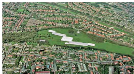
ルーブル・ランス Francis Bocquet, SANAA © SANAA / Imrey Culbert / Catherine Mosbach