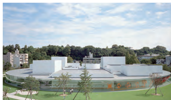
金沢 21世紀美術館

SANAA (サナア) Sejima and Nishizawa and Associates 妹島和世と西沢立衛が1995年に設立した建築家ユニット。代表作に「金沢21世紀美術館」(金沢市、2004年)「トレード美術館ガラスパビリオン」(米国、2006年)「海の駅なおしま」(香川県直島町、2006年)、「ニュー・ミュージアム・オブ・コンテンポラリー・アート」(ニューヨーク/米国、2007年)「ROLEX ラーニングセンター」(スイス、2010年)などがある。現在、2012年開館予定の「ルーブル・ランス」(仏)などのプロジェクトが進行中。2010年には建築界のノーベル賞と称される米プリツカー賞を受賞した。