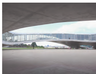
ROLEX ラーニングセンター ©SANAA