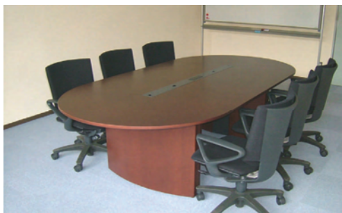
法律相談が行われるリーガルクリニック室

*当日は、ご予約時間5分前までに法律相談室受付（裏面地図参照）にお越しください。