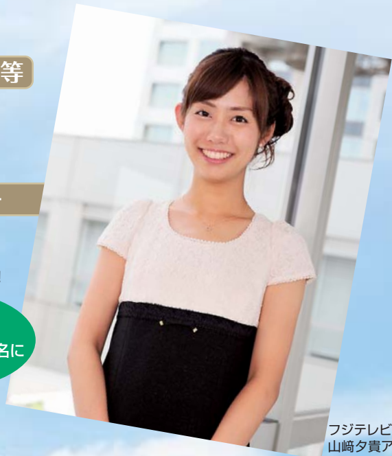
フジテレビ 山崎夕貴アナウンサー