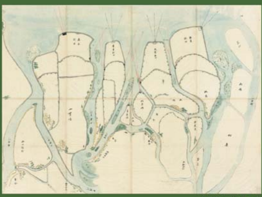
嶋屋新田新道之図