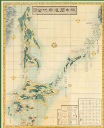
蝦夷蘭境輿地全図