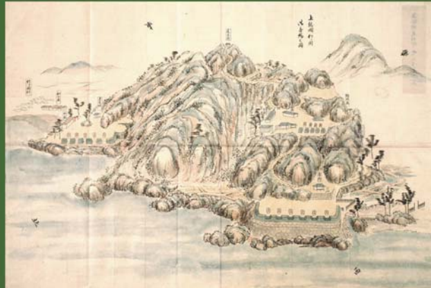
上総国竹ヶ岡御台場之図