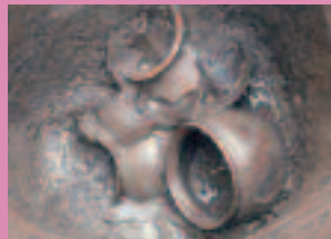
弥生土器出土状況（鹿田遺跡）