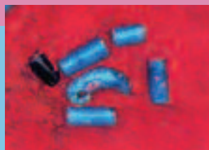
玉類出土状況（楯築弥生墳丘墓）