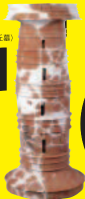
特殊器台 (桶築弥生墳丘墓)