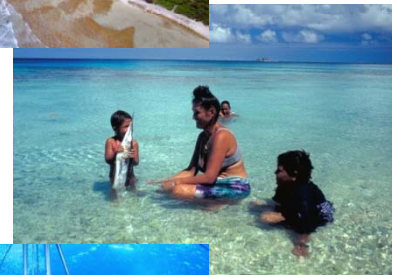
フレンチ ポリネシア の人々