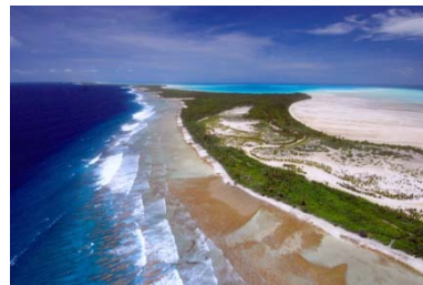
キリバス共和国 タラワ環礁の サンゴ礁と 洲島

今回のサイエンスカフェでは、私がこれまでに行ってきた環礁国(キリバス共和国、ツバル、マーシャル諸島共和国、モルディブ共和国)での現地調査を基にして、これらの国々の自然環境とその成り立ち、災害、そこに住む人々の生活についてお話しします。温暖化時代の脆弱性はどこにあるのか、美しいスライドを見ながら人間の課題を一緒に考えてみましょう。