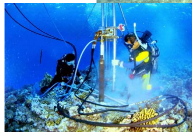
水中ボーリング 調査 マーシャル 諸島共和国 マジロ環礁 にて