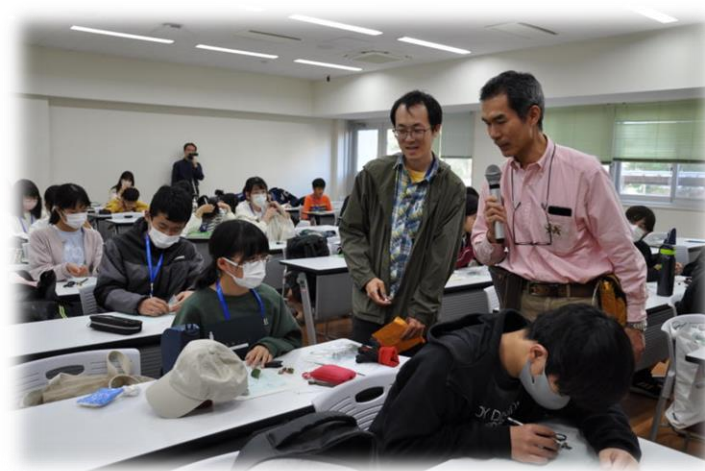
採取した昆虫や植物を描いたスケッチの視点を紹介