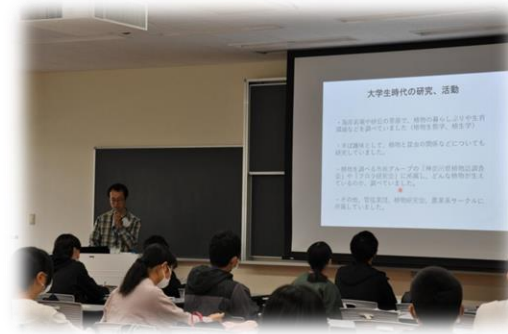
鐵先生が研究者を目指した経緯