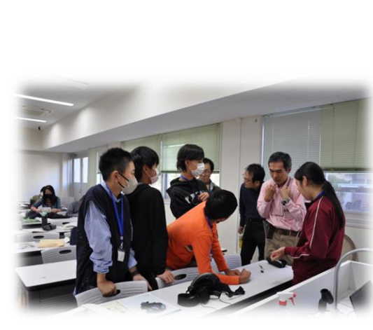
講座後、講師の先生に質問