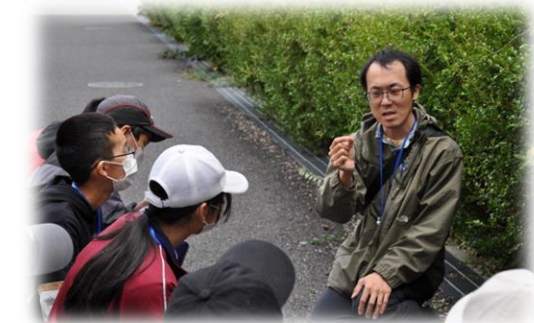
採取した植物の特徴について解説