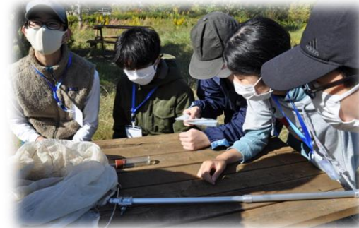
水循環施設で採取した昆虫について解説