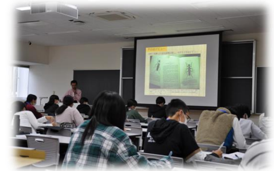
奥島先生が研究者を目指した経緯