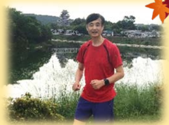
岡山城をバックに旭川沿いを走る筆者↑

学会で訪れた他の街でもよくジョギングをしますが、日本で一番爽快に走れて美しいのは岡山のこのコース。皆様も一度楽しんでみませんか。