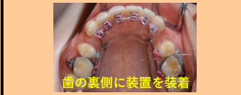
歯の裏側に装置を装着