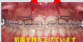
前歯を持ち上げています