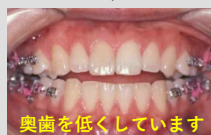
奥歯を低くしています