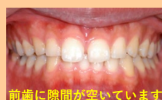
前歯に隙間が空いています