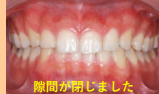
隙間が閉じました