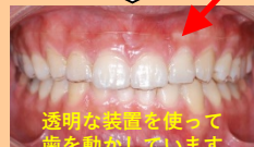
透明な装置を使って 歯を動かしています