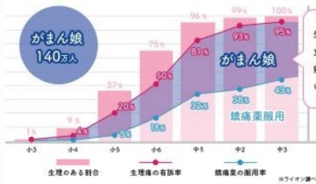
学年別 生理痛有訴率とがまん娘の割合